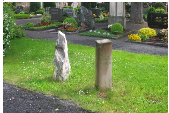
mit Grabstein (Steele)