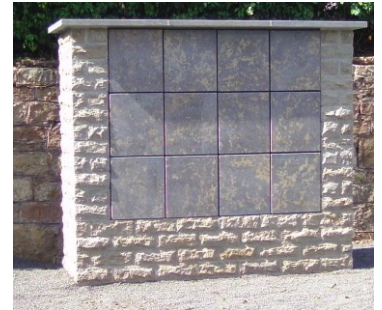
neue Urnenwand an der nördl. Friedhofsmauer